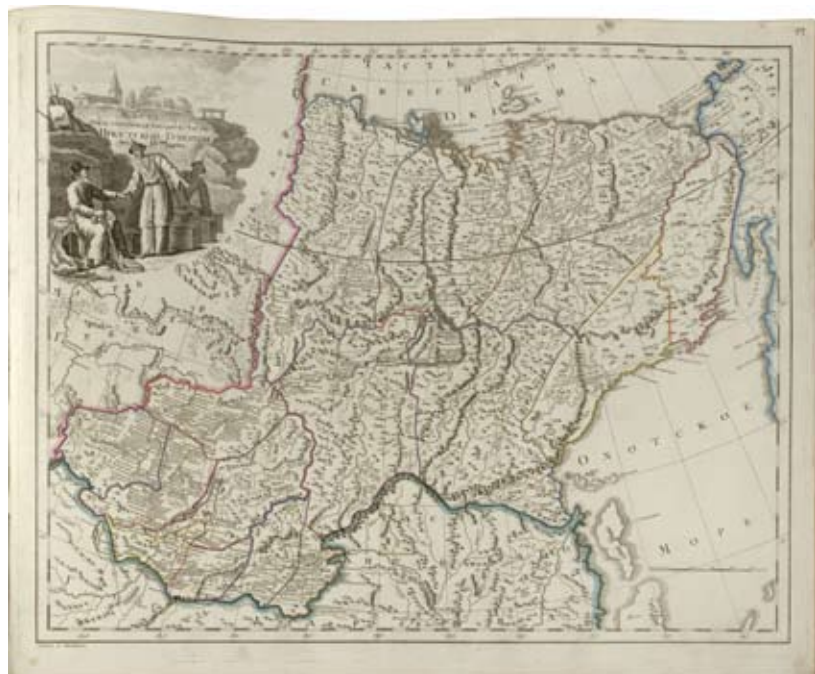
Иркутская губерния 1800 г.

падной Сибири были отнесены Тобольская, Томская губернии и Омская область, к Восточной Сибири – Иркутская, вновь образованная Енисейская губерния, Якутская область, Охотское и Камчатское приморские управления и Троицкосавское пограничное управление. Губернии делились на округа, а последние – на волости и инородные управы.