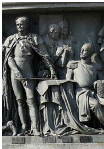
Фрагмент памятника к 1000-летию России

Существенной функцией губернатора и губернского совета являлся надзор над всей губернской и окружной администрацией. В непосредственной власти губернатора оставались наиболее важные вопросы управления, надзора и даже судопроизводства.