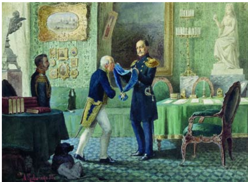
А. Кившенко. Император Николай I награждает Сперанского

Административные преобразования М.М. Сперанского обозначили определенный поворот в «окраинной» политике самодержавия, что свидетельствовало о признании необходимости установления для Сибири особой системы управления. Это была первая попытка подойти к проблемам управления огромным, богатым ресурсами краем комплексно, что указывало на определенное стремление выработать правительственную «концепцию Сибири».