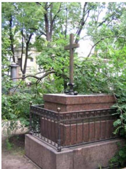
Могила М.М. Сперанского в Александро-Невской лавре

Но жить с графским достоинством Михаилу Михайловичу оставалось недолго. 11 (23) февраля 1839 г. он умер от простуды. Похоронен этот выдающийся сын России в некрополе мастеров искусств Александро-Невской лавры. На похоронах присутствовали император Николай I, императорский двор в полном составе, дипломатический корпус. Авторы настоящего издания в период