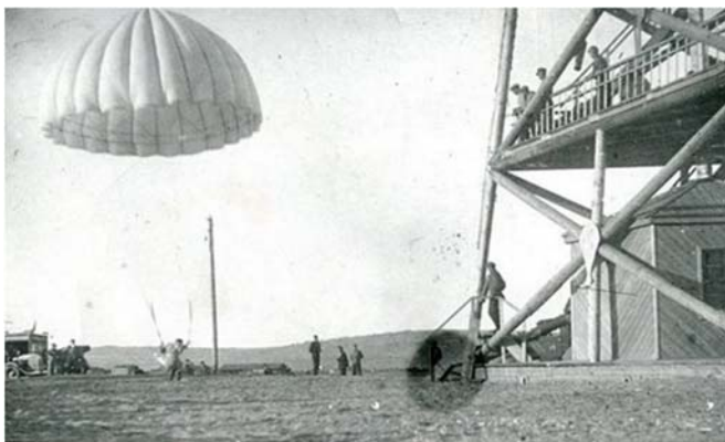
Рис. Вышка аэроклуба Осоавиахима при заводе № 125 им. Сталина (середина 1930-х гг.)

Основную роль в развитии военно-прикладных и оборонно-технических видов спорта в конце 20-х – начале 30-х гг. XX в. играло Общество содействия авиации и химической промышленности (Осоавиахим), образованное 23 января 1927 г. в результате слияния двух смежных организаций – Авиахима и Общества содействию обороне СССР. Оно просуществовало в Иркутской области до 1948 г. Особенно популярными среди населения были авиационные, стрелковые, автомобильные и парашютные секции отделений Осоавиахима (рис.), тем самым обеспечивалась массовость общества в регионе (табл. 2) [7, с. 21].